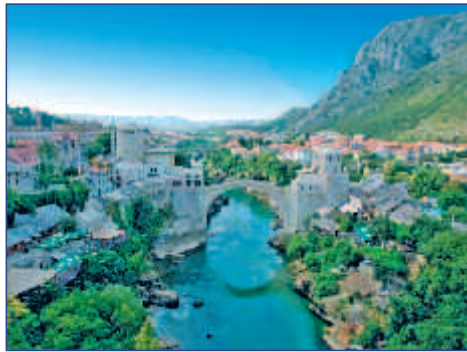
Die Brücke „Stari Most“ in Mostar