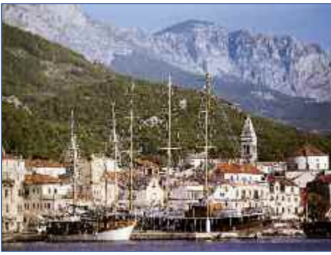
Die Küstenstadt Makarska