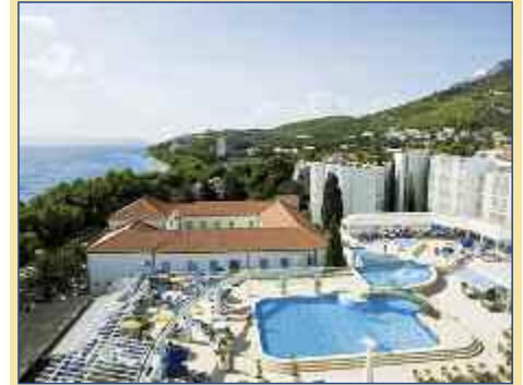
Pool des Hotel Alga

Jahr nach der feierlichen Wiedereröffnung wurden die Brücke, ein Symbol für Hoffnung und Versöhnung, und die Altstadt von Mostar zum Kulturdenkmal der UNESCO erklärt. Die Rückfahrt zu Ihrem Hotel führt Sie entlang der alten Napoleon-Straße durch das Hinterland von Biokovo – von hier aus genießen Sie einen wunderschönen Blick auf die mitteldalmatinische Inselwelt. Hinweis: Für diesen Ausflug benötigen Sie einen gültigen Reisepass oder Personalausweis.