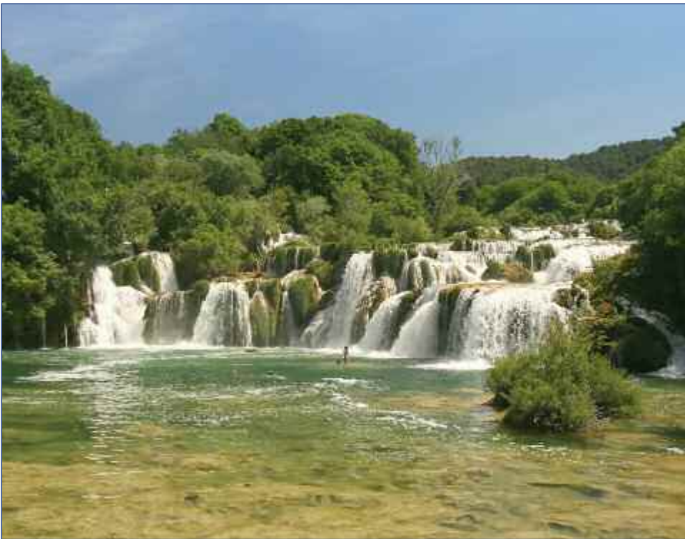
Atemberaubende und glitzernde Krka-Wasserfälle

E ine Reise nach Kroatien verspricht weit mehr als Badefreuden an der herrlichen Adriaküste. Entdeckungsfreudige Besucher kommen in Dubrovnik, der Stadt der Kreuzritter, Pilger und Abenteurer voll auf ihre Kosten. Klöster, Kirchen, Museen und Paläste sind Zeugen eines reichen kulturellen Erbes. Und das Schönste an Dubrovnik ist, dass man alles bequem zu Fuß erreichen kann. Kontrastreiche Eindrücke vermitteln auch die Ausflüge nach Sibenik, Mostar, Split und Trogir. Von atemberaubender Schönheit sind die Krka-Wasserfälle. All dies, das reiche kulturelle Erbe, ein vielseitiges und reizvolles Landschaftspanorama, dazu gastfreundliche Menschen und ein angenehmes mediterranes Klima machen Kroatien zu einem äußerst lohnenden Reiseziel.