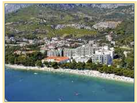
Ihre Hotels liegen direkt am Meer