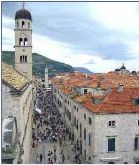
Die Altstadt von Dubrovnik