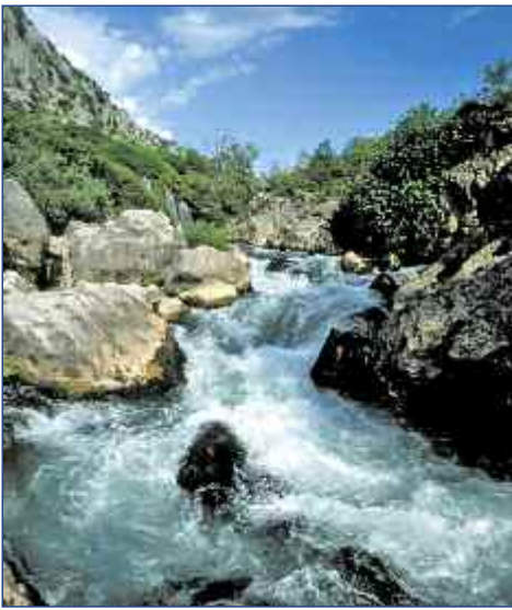
In der Cetinaschlucht