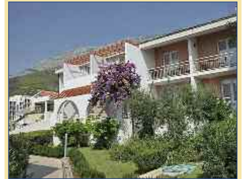
Gartenanlage des Hotel Afrodita

Nach der Fahrt über einen Gebirgspass erleben Sie oberhalb des ursprünglichen Seeräuberstädtchens Omis ein atemberaubendes Panorama auf die tiefe Schlucht des Cetina-Flusses, das weite Meer und das beschauliche Küstenstädtchen. Tausend Jahre lang gestaltete die Cetina wundersame Formen in das Gestein des gewaltigen Canyons. Von Omis aus führt Sie eine gemütliche Bootsfahrt flussaufwärts durch die wildromantische Cetinaschlucht zu einem idyllisch gelegenen Uferrestaurant, wo man Sie mit typischen einheimischen Spezialitäten verwöhnen wird. Anschließend machen Sie noch einmal Halt in Omis, wo Ihnen genügend Zeit für einen Rundgang durch den mittelalterlichen und venezianisch geprägten Stadtkern mit sei-