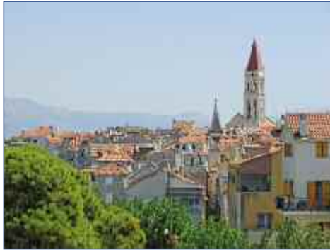
Blick über die Altstadt von Trogir