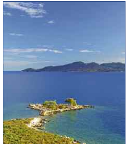
Kroatien - eine mediterrane Schönheit