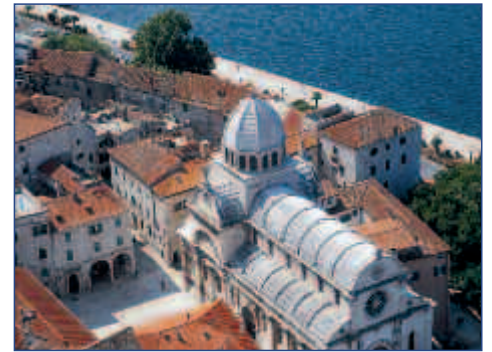
Die Kathedrale in Šibenik

17.04. BIS 24.04.2012 • FLUG AB/AN DORTMUND • AB € 849,- P.P. IM DZ